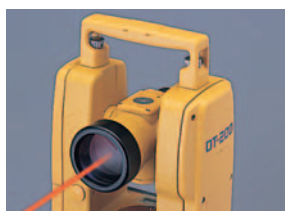
スイッチ一つの簡単操作

ボタン一つで極めて小さなスポット径で、視線方向にレーザーポインターを射出します。 作業者は、観測者の誘導なしに正確な作業をする事が出来ます。