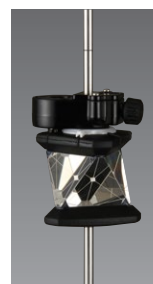
●ATP1SII (ピンボール用) プリズム高100~400mmの間でスライドし、任意の高さへ固定できます。