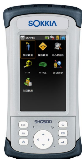
データコレクター SHC500